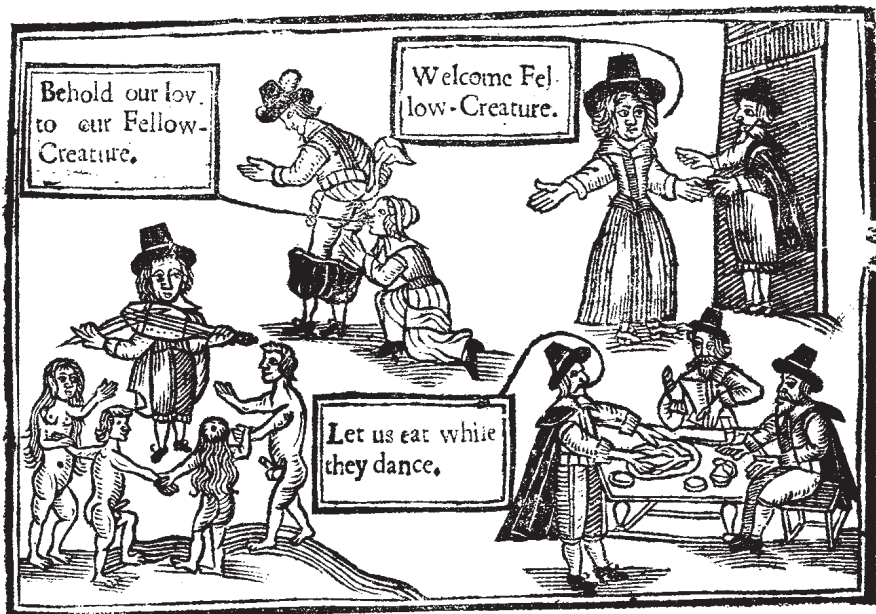
Extrait d'un «tract» ranter

tation de la toute-puissance divine: «Le diable ne saurait commettre le mal sans que Dieu ne lui en accorde le pouvoir, d'où il ressort que le diable n'est point aussi responsable que les hommes le pensent (...)» 4 .