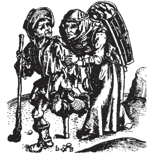
Mendiants, gravure 17 ème siècle

De notoriété publique, les auberges et les tavernes de campagne où s'arrêtaient les itinérants étaient des centres d'information et de discussion. Les efforts aussi vains qu'acharnés des juges de paix