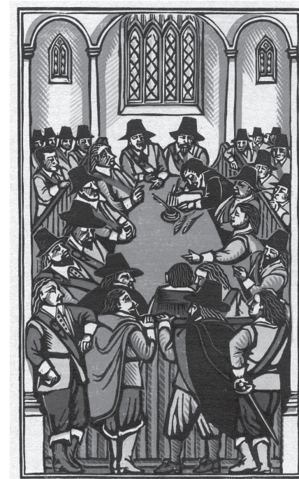
Les débats de Putney

ficiers qui tentèrent d'endormir les débats en s'en tenant à des positions formalistes sur le respect des lois votées, la nécessité de rétablir la légalité dans le pays, etc. Rien de décisif ne sortit de là. Au cours de ces débats, les Agitateurs avaient déjà perdu l'initiative. Il se produisit un retournement spectaculaire de la situation de juin. À cette époque, les simples soldats agissaient dans l'unité et détenaient l'initiative: les Agitateurs s'étaient emparés du roi et les officiers avaient été contraints de s'incliner devant le fait accompli au rassemblement général de Newmarket. En novembre, au contraire, les soldats étaient déjà divisés et avaient perdu l'initiative. Rien de concret ne se profilait à l'horizon. Cromwell et les officiers gagnèrent du temps. Un rassemblement général des troupes était prévu par le Conseil de l'Armée au cours duquel l'Accord du Peuple devait une nouvelle fois être présenté. Les Agitateurs comptaient bien le faire ratifier. Le Conseil fut ajourné et les officiers magouillèrent si bien que le rassemblement général fut remplacé par trois assemblées séparées. On apprit en outre la fuite du roi, vraisemblablement favorisée par des officiers. Les trois assemblées se tinrent séparément. Les généraux firent la promesse de payer les arriérés de solde et de vagues déclarations