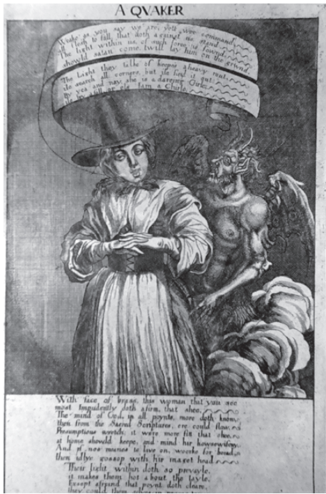
Caricature d'une prêcheuse Quaker (elles étaient nombreuses) représentée avec un chapeau pointu de sorcière et auprès du diable

par les pouces), réduisirent au silence leurs principaux meneurs, sans toutefois entamer l'enthousiasme de leurs partisans anonymes.