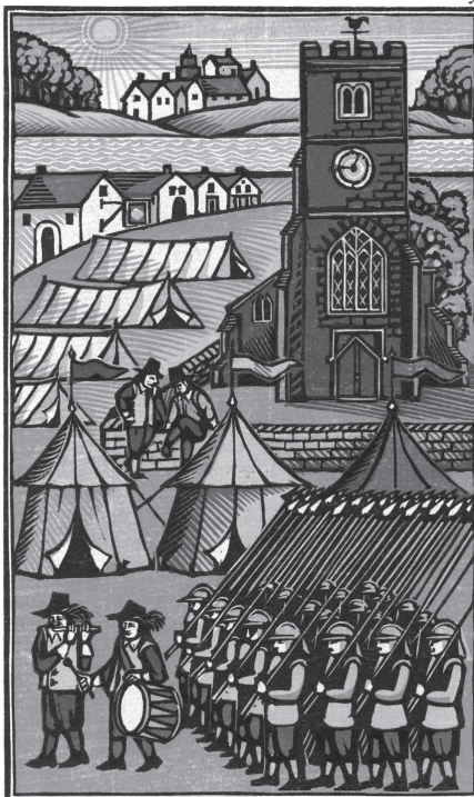
L'armée «nouveau modèle» à Putney