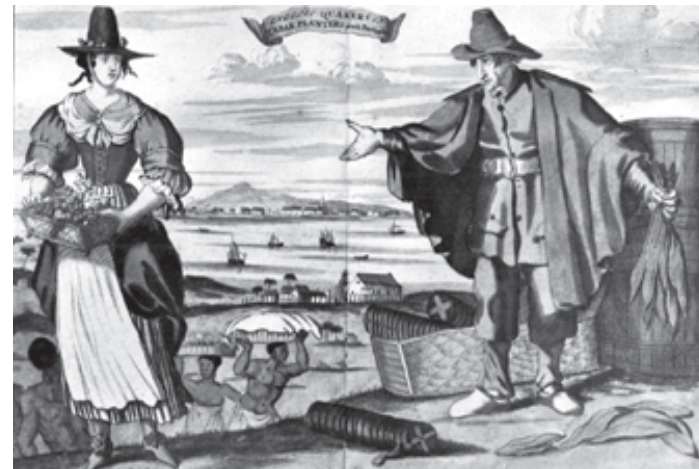
Des Quakers anglais, planteurs de tabac et esclavagistes, aux Barbades, vers 1680